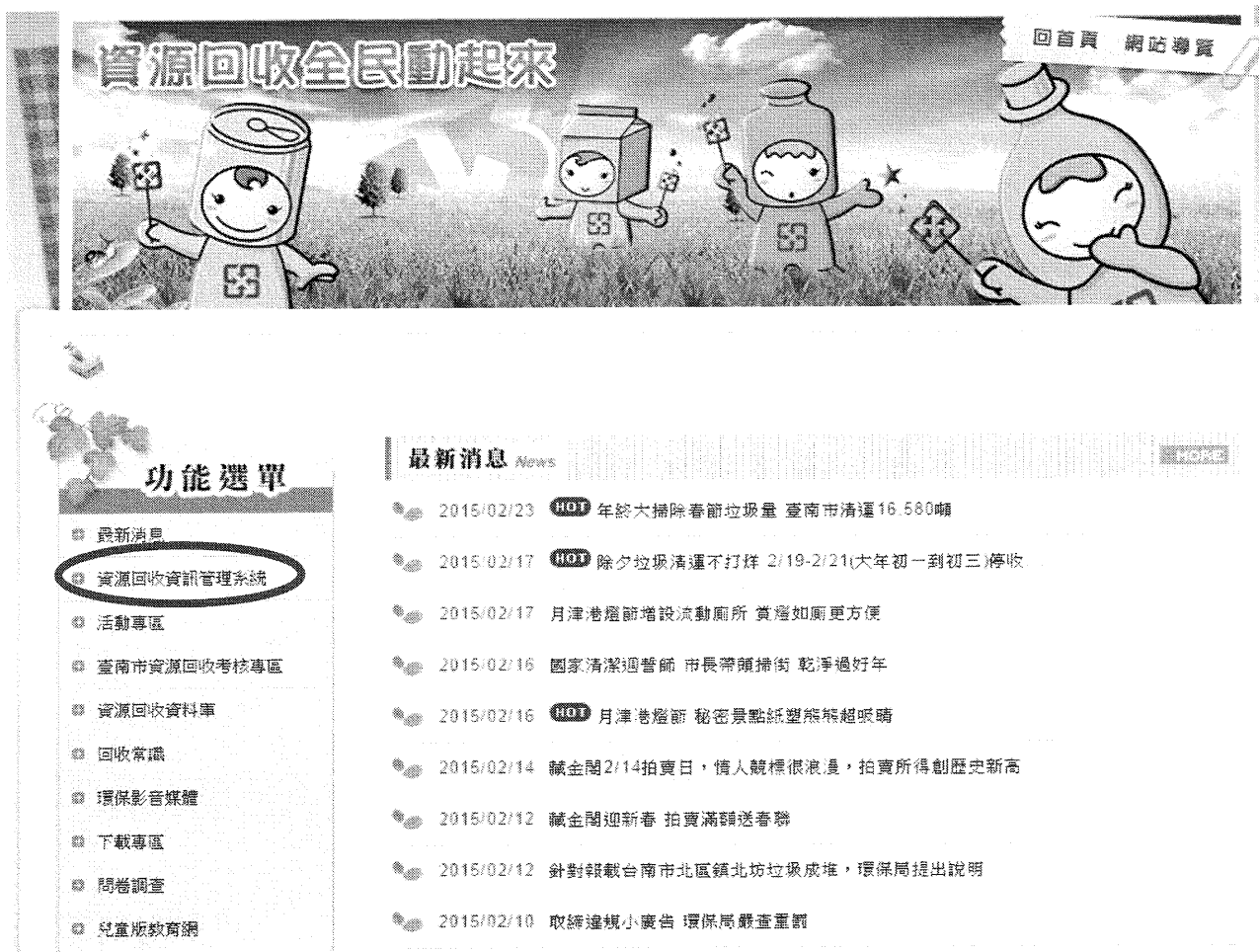
資源回收全民動起來網站首頁截圖