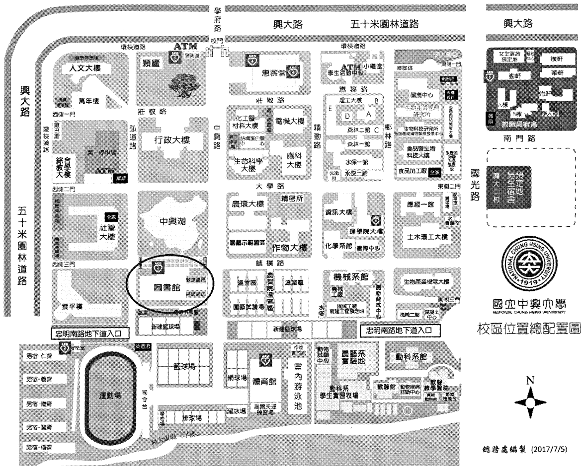
國立中興大學 校區位置總配置圖