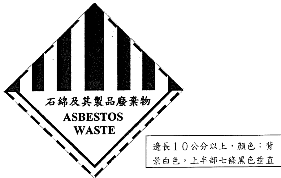
圖 2、有害事業廢棄物特性之標誌-石綿及其製品廢棄物