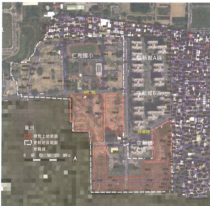
二空新村-標售土地位置示意圖